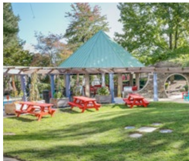
Jardim de Cura Balise

A casa oferece um local sem estresse para as famílias se afastarem do hospital, fazerem uma refeição e compartilharem um sistema de apoio exclusivo com outras famílias, funcionários e voluntários atenciosos. Não há nenhum custo para ficar no Ronald McDonald House. Para obter mais informações, fale com seu assistente social no hospital ou ligue diretamente para a Ronald McDonald House of Providence em 401-274-4447.