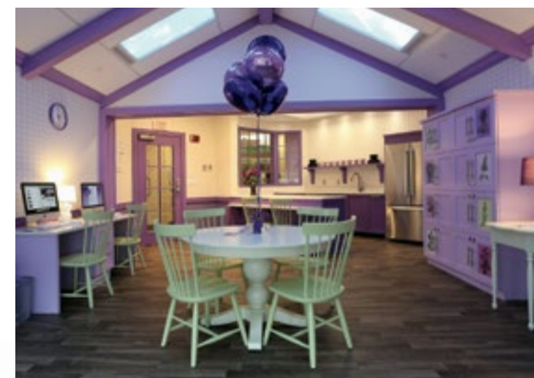
O Quarto Família Izzy

A sala da Família Izzy está localizado no 5º andar. Este é um espaço familiar para pais/cuidadores e pacientes. A Fundação Izzy oferece lanches, café, produtos de higiene e refeições na maioria dos dias. Há uma cozinha, microondas, computadores, televisão e assentos confortáveis. Para sua comodidade, o espaço funciona 24 horas por dia. Solicite à secretaria da unidade o código de acesso