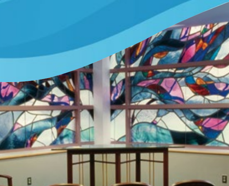
Hasbro Children's Chapel